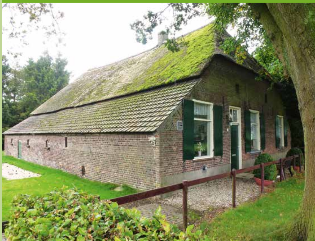
Boerderij op Koolwijk te Berchem, gemeente Oss.

Stichting de Brabantse Boerderij zoekt Vrienden. Vanaf € 22,- per jaar bent u Vriend van onze Stichting. U ontvangt daarvoor onze Nieuwsbrief met wetenswaardigheden over Brabantse boerderijen, bijgebouwen, erf en cultuurlandschap en aankondigingen van onze activiteiten. Ook krijgt u korting op onze publicaties en cursussen en u kunt deelnemen aan onze jaarlijkse Vriendendag. Maar vooral steunt u als Vriend het werk van SdBb.