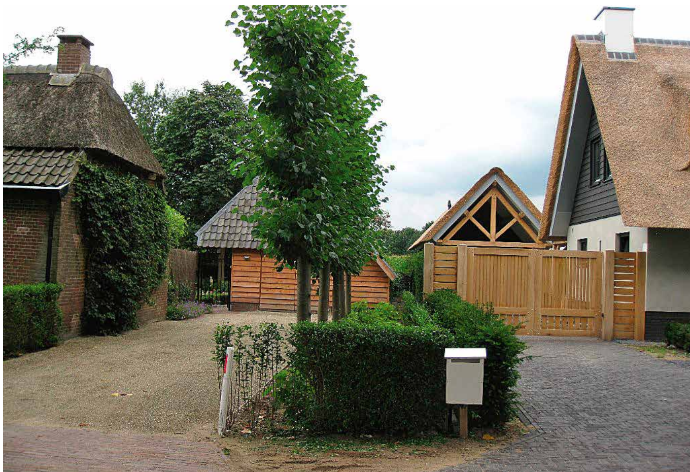
De situatie in de Koffiestraat in Heeswijk-Dinther.

NB: vergunningsvrije bouwwerken zijn bij Rijksmonumenten, provinciale en gemeentelijke monumenten en beschermde stads- en dorpsgebieden vergunningplichtig (art. 43 lid 2 sub a WW). Bij beeldbepalende panden blijven vergunningsvrije bouwwerken vergunningsvrij. Deze laatste bouwwerken kunnen dus niet preventief getoetst worden aan redelijke eisen van welstand.