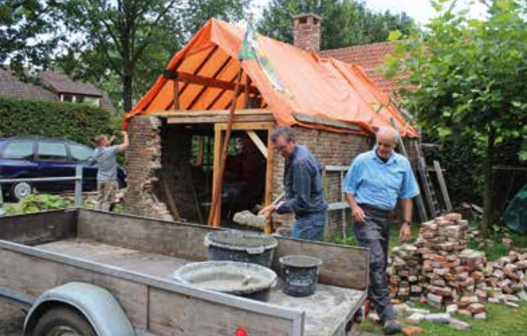
De eerste restauratie van een bakhuis in Liempde door SPPILL en SdBB is van start gegaan.