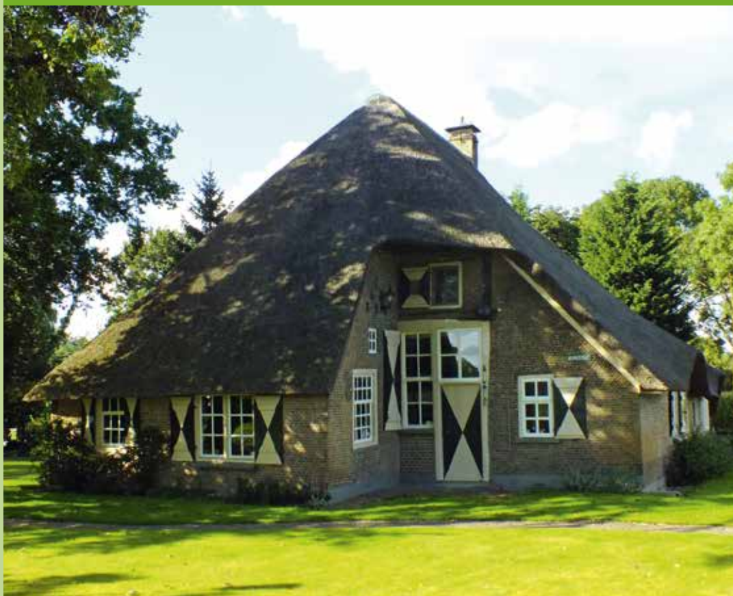
Hoekgevelboerderij Heuvelstraat, Heeswijk-Dinther

Stichting de Brabantse Boerderij zoekt Vrienden. Vanaf € 20,- per jaar bent u Vriend van onze Stichting. U ontvangt daarvoor onze Nieuwsbrief met wetenswaardigheden over Brabantse boerderijen, bijgebouwen, erf en cultuurlandschap en aankondigingen van onze activiteiten. Ook krijgt u korting op onze publicaties en cursussen en u kunt deelnemen aan onze jaarlijkse Vriendendag. Maar vooral steunt u als Vriend het werk van SdB. U kunt zich aanmelden op onze website.