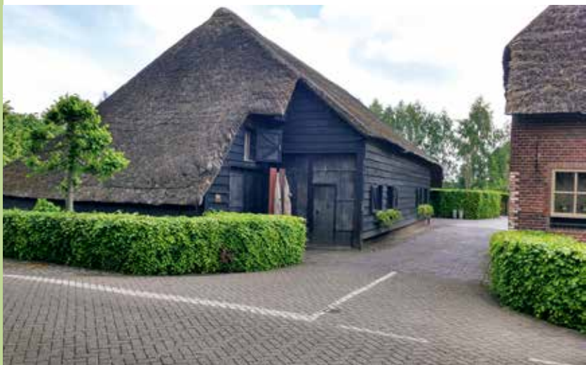
Schuur in Alphen-Oosterwijk