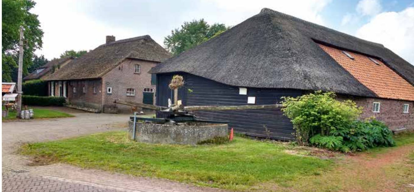
Nogmaals Alphen-Oosterwijk. Boerderij met Vlaamse schuur