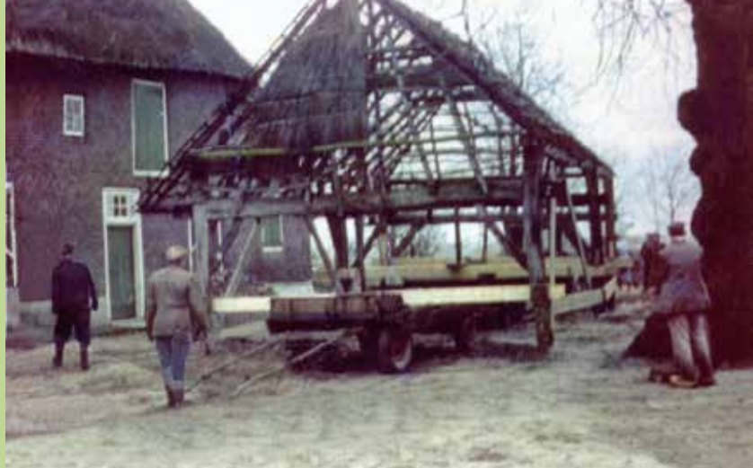
Een schuur bij de hoeve Boomen wordt verplaatst in de jaren 60 van de vorige eeuw.

RESTAURATIE - RENOVATIE - RECONSTRUCTIE - HERBESTEMMING