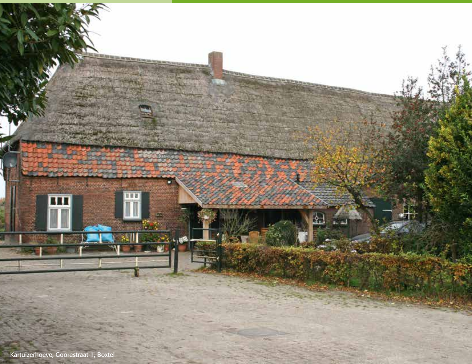
Kartuizerhoeve, Goorestraat 1, Boxtel

SdBb brabantse boerderijen, bijgebouwen, erf en cultuurlandschap.