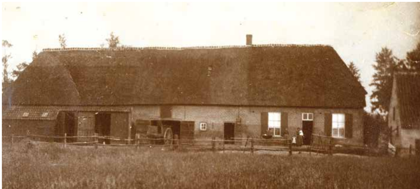
Oude opname van de kartuizerhoeve op Goorestraat 1, Liempde.

Uit de flaptekst: Koop je in 1835 als Brabants gouverneur een