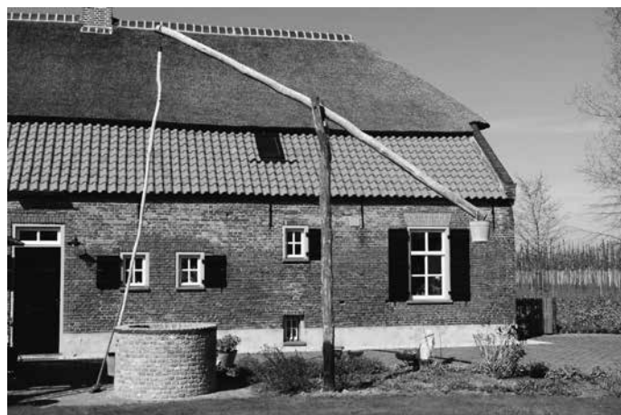
Een nieuw gemetselde put, compleet met putmik, in St Oedenrode.