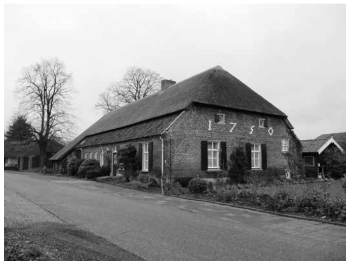
Deze boerderij op De Hoof in Someren behoorde tot de Postelse hoeve Ten Roode. De hoeve groeide door splitsingen tot een gehucht van 6 boerderijen.

Dankzij de inzet van enkele lokaal goed bekende heemkundigen en historici werden middels verpondingsregisters, schepenbrieven en cijnsboeken heel wat hoeven teruggevonden. In totaal zijn 82 van de 100 hoeven met goede zekerheid gelokaliseerd. Van die hoeven is dus ook duidelijk waar ze in de wereld van nu staan: we kunnen de huidige situatie gaan bekijken. Zo krijgen we in ieder geval drie waarnemingsmomenten: 1662 (het Verbaal), 1831 (de kadastrale gegevens) en de huidige situatie. Het zijn twee vrijwel gelijk grote stappen door de tijd: 169 en 184 jaar. Ze geven op drie momenten een beeld van de toestand van de boerderijen.