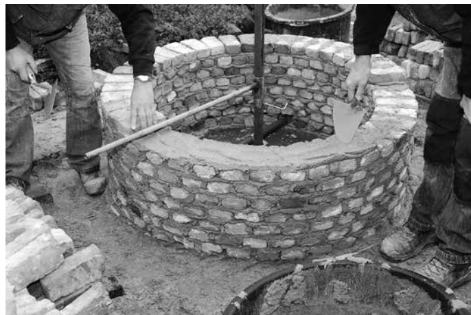
Met speciale taps toelopende stenen wordt de put mooi rond.