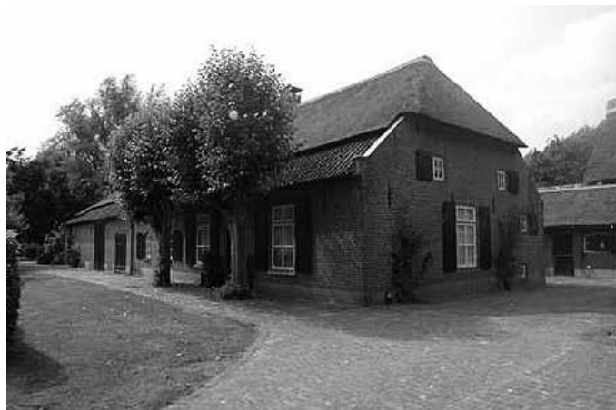
Urkhovenseweg 71 in Tongelre (Eindhoven) was voorheen het goed Ter Beek van het klooster Binderen.

hoeven interessante waarnemingen aan de resterende gebouwen te doen. Het zijn deze gebouwen waaraan door bouwhistorisch onderzoek vragen kunnen worden gesteld over de verandering van kortgevel naar langgevel, van vlechtwerkwand naar stenen wand (de "verstening") en van strodak naar rietendak met pannenrand. De eerste afspraken zijn alweer gemaakt!