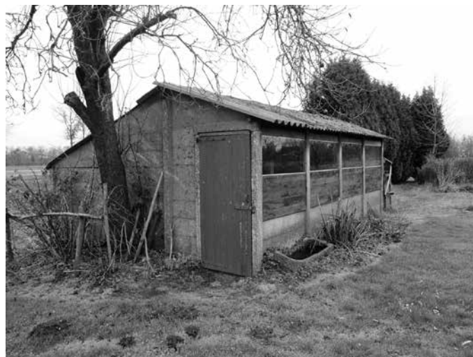
Kippenhok in Oploo