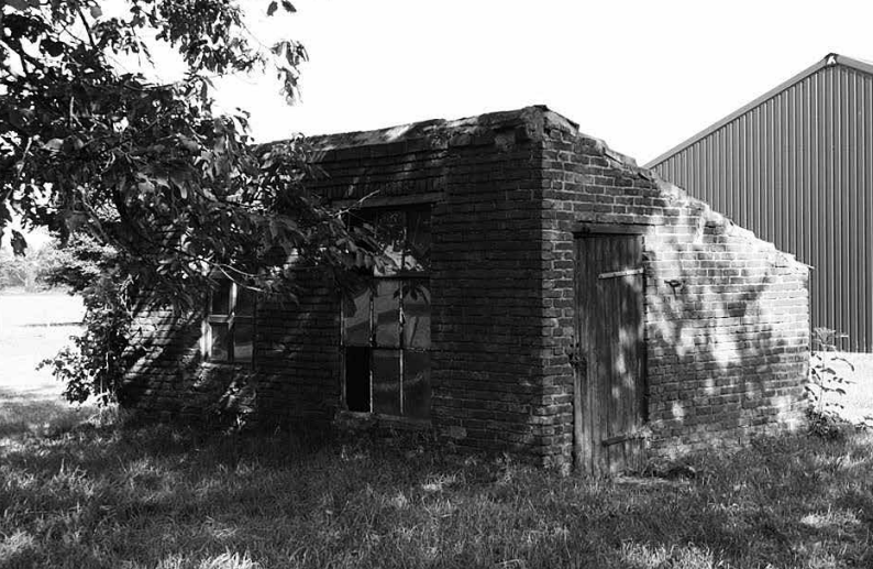
Gemetselde kippenhokken zijn zeldzaam geworden.