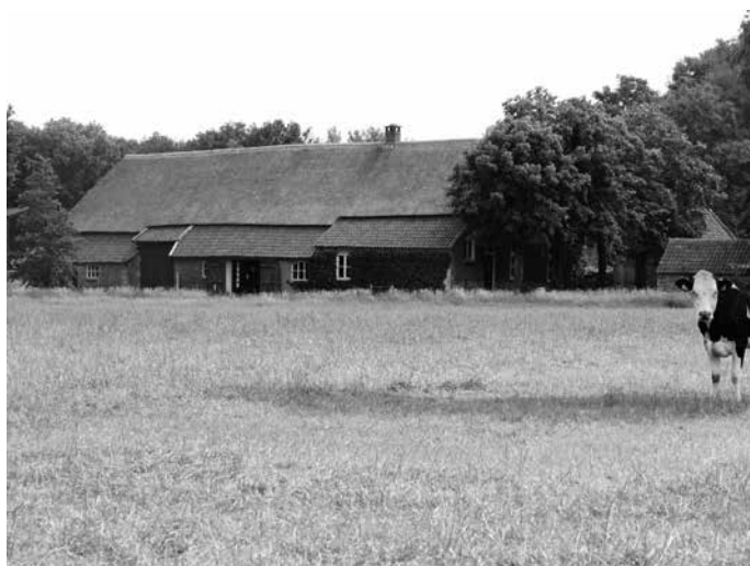
De voormalige Postelse Hoeve Ten Berge in Lierop.

De gebouwen bleken op 61 adressen te staan, waarvan er 59 bezocht zijn. Daarvan werd bij 21 geoordeeld dat het om "nieuwbouw" uit de laatste anderhalve eeuw ging, waarbij geen oudere elementen bewaard bleven. Er bleken maar liefst 43 gebouwen te zijn waarin wél oudere elementen aanwezig zijn of op goede gronden vermoed mogen worden. De 43 gebouwen horen bij 23 hoeven uit het Verbaal van 1662. Bij 32 van deze 43 konden foto's worden gemaakt. In niet minder dan twintig gebouwen was er nog een oud, soms heel oud en zwaar, gebint aanwezig en in nog acht andere werden daarvan resten gezien. Bij zestien boerderijen was er nog een kelder en opkamer aanwezig. Bij drie gebouwen werden metseltekens aangetroffen en ook bij drie was er nog een wand van gedroogde leemblokken aanwezig.