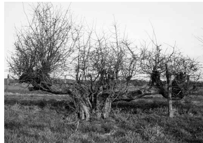
Relicten van vlecht heggen

Tegelijk met het verdwijnen van de heggen ging ook de flora en fauna verloren die gebonden waren aan die heggen en er hun leefgebied hadden. Dit geldt met name voor de struweelvogels zoals de geelgors, kneu en de grauwe klauwier en andere soorten met name de sleedoornpage en de hazelmuis. Kortom, het Nederlandse heggenvlechten, een prachtig wandel en fietsgebied met zeer belangrijke ecologische- en cultuurhistorische waarden, hebben we opgeofferd voor onze welvaart.