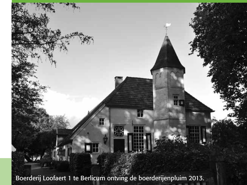
Boerderij Loofaart 1 te Berlicum ontving de boerderijenpluim 2013.