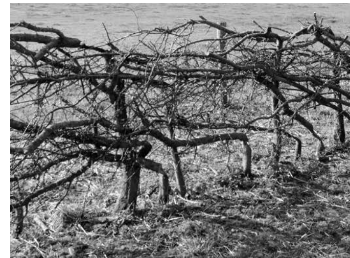
Een nieuwe vlecht heg

beurt dit langs de Maas en IJssel. Het jaarlijks terugkerend Nationaal Kampioenschap Maasheggenvlechten is uitgegroeid tot een van de grootste landschapsevenementen van Nederland. Ook pleiten wij voor het behoud van onze traditionele vlechtmethodes. Elke regio had zo zijn eigen tradities en technieken als het om vlechten van heggen gaat. Belangrijk is om die eigen stijl weer terug te brengen in plaats van de introductie van buitenregionale of zelfs van buitenlandse vlechtstijlen. Een stukje cultuurhistorisch karakter van de eigen streek wordt weer hersteld en voor plant en dier ontstaat dan weer een ideaal leefgebied. Zo wordt een bijdrage geleverd aan het welzijn en aan de leefbaarheid van de eigen woonomgeving.