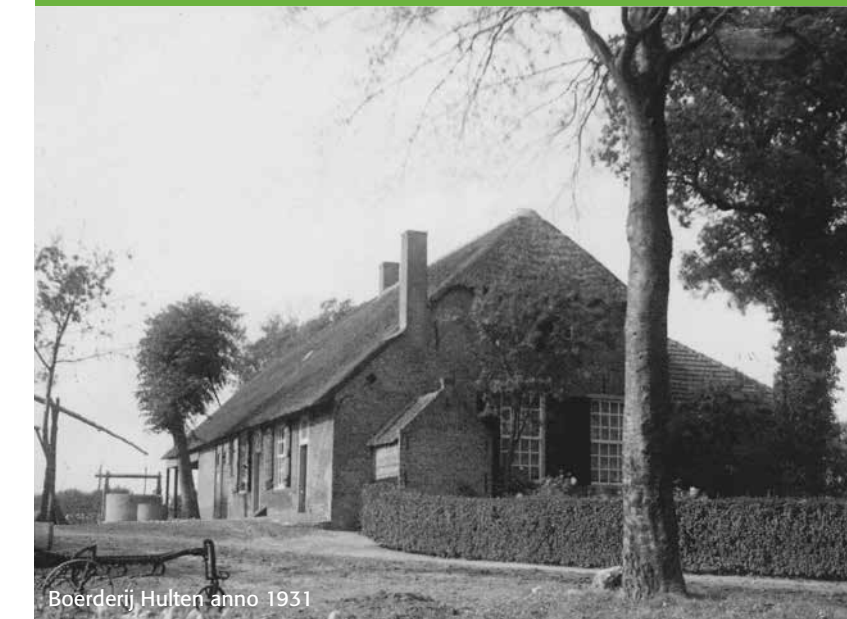
Boerderij Hulten anno 1931