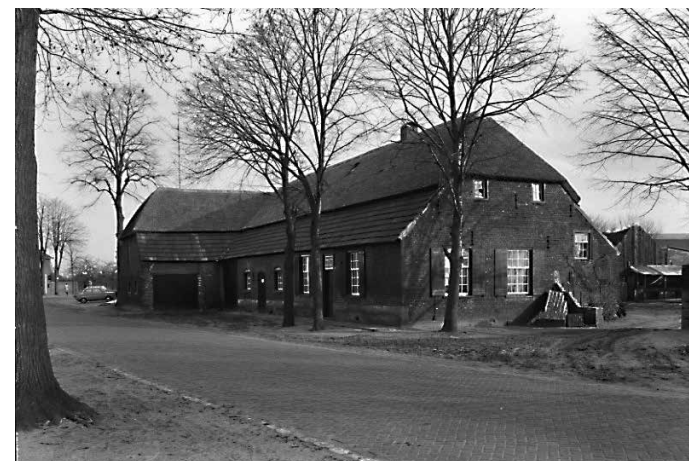
Een boerderij in Borkel en Schaft, die bezocht wordt op de vriendendag.