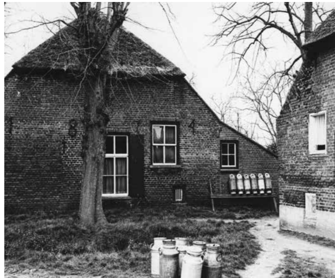
Achterbos 10 met muurankers 1874 en rechts een stukje van nr 8.

de statenhoeven in de Meierij. Stichting De Brabantse Boerderij is samen met auteur Karel Leenders een publicatie hierover aan het voorbereiden. Naast de beschrijving van 1662 wordt geprobeerd om tevens vast te stellen wat er heden ten dage nog resteert van al die statenhoeven. Achterbos in Asten is hiervan een prachtig voorbeeld.