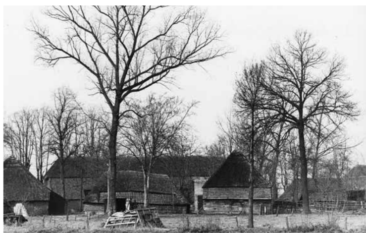
De achterkant van boerderijen op Achterbos in Asten.