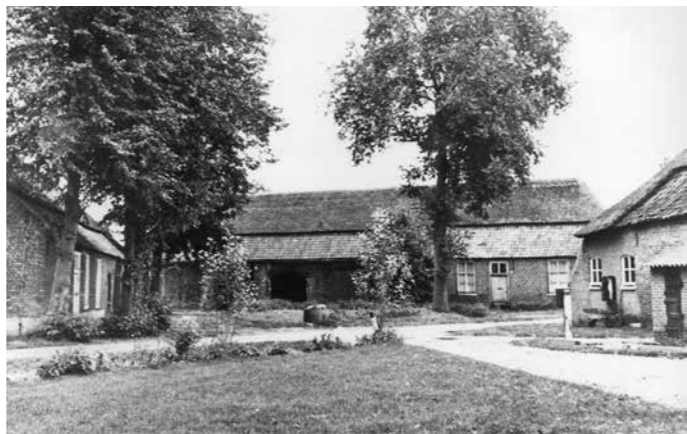
Links Achterbos 8, midden nr 6 en rechts nr 9.