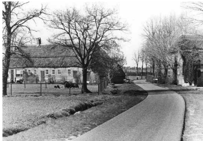
Een oude opname van links Achterbos 9, dat de oude kern blijkt te zijn van de Binderse hoeve en rechts nummer 6, een latere afsplitsing.

Historische boerderijen vinden we in onze provincie zowel in de vorm van losstaande hoeven verspreid in het landschap als in dichte clusters bij elkaar in gehuchten, maar ook in allerlei groeperingen daartussen. De clusters van dicht bij elkaar gelegen boerderijen vallen het meest op. Een bijzonder voorbeeld daarvan is het gehucht Boomen in Lierop, een beschermd dorpsgezicht dat bij veel boerderij liefhebbers bekend zal zijn. Dat kluitje boerderijen is ontstaan uit één enkele hoeve die in vroegere eeuwen eigendom was van de abdij Postel. Een ander voorbeeld is een groepje boerderijen aan Achterbos in Asten. Die boerderijen komen voort uit de hoeve Achterbos, die eigendom was van de abdij van Binderen in Helmond. Zolang een bepaalde hoeve behoorde tot de eigendommen van een klooster, abdij of andere kerkelijke instelling, bleef de hoeve in het algemeen in zijn geheel als eenheid bestaan. Grotere hoeven die in particulier bezit waren vielen vaak uiteen in meerdere delen als gevolg van bijvoorbeeld erfdelingen tussen erfgenamen. Achterbos is een oude hoeve waar beide ontwikkelingen voorkwamen. We willen hier beschrijven hoe uit die enkele oude hoeve van de abdij van Binderen een dicht op elkaar gelegen kluitje van boerderijen kon ontstaan.