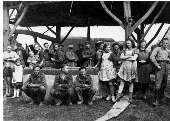
De hele buurt werd opgetrommeld voor het verplaatsen van een schuur op Hoenderbosch in Uden. Natuurlijk ook even poseren voor de camera van kapelaan Mutsaerts.

Soms werd het complete gebouw verplaatst, soms werd het aanwezige roggestrooien dak intact gelaten, zoals op de foto van een schuurverplaatsing op buurtschap Hoenderbosch in Uden in 1935. Daarvoor was de hoogkar (en die van de burens) nodig. Van vier boerenkarren werden de burries verwijderd, daarna werden twee hoogkarren aan een balk gekoppeld. Tijdens het transport reden de wielen over een planken ondergrond.