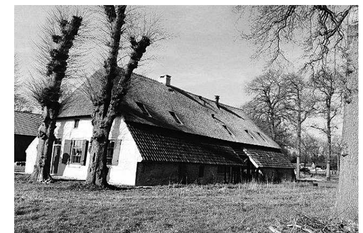
Ook boerderij De Duinse Hoeve in Rosmalen wordt bezocht op de Vriendendag van SdBB.

Het verplaatsen, maar gezien onderstaande advertentie, ook het verhandelen van houten gebouwen, vond niet alleen bij ons in de buurt plaats. In onderstaande advertentie uit 1859 wordt een 'eiken timmer' aangeboden uit de hand te koop. Naar alle waarschijnlijkheid betreft het een gedomonteerd houtskelet van een boerderij of schuur. Aangegeven wordt dat de 'timmer' geschikt is voor het bouwen van een huis. In 1859 was vakwerkbouw in de streek rond het Belgische Sint Truiden nog steeds gangbaar.