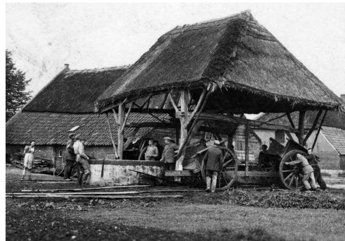
Een schuur op karrewielen. Uden, Hoenderbosch, 1935.