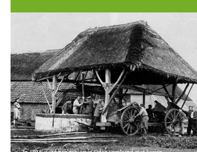
In 1935 werd een schuur in Uden verplaatst met karren.