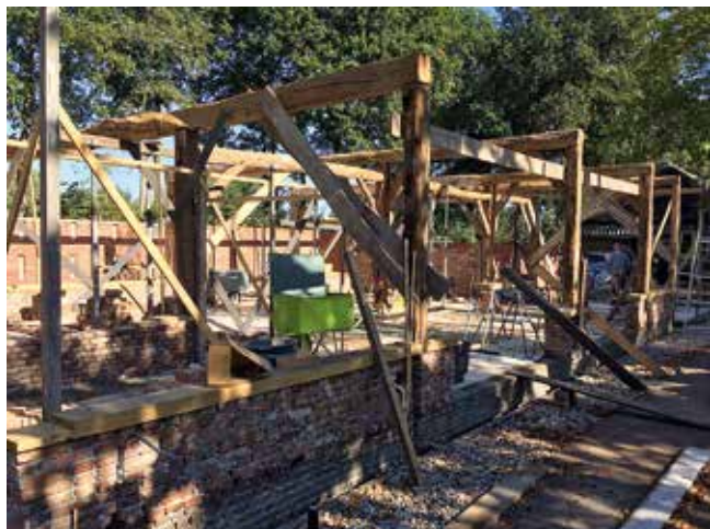
Herbouw van de schuur in Haaren.

In het kader van het project Reanimatie Verloren Erfgoed worden oude schuren, die niet gehandhaafd kunnen blijven, gedemonteerd met als doel ze elders weer verantwoord op te bouwen. Op Groendomein Wasven in Eindhoven is een oude veldschuur uit Bavel herbouwd en in Haaren wordt een schuur herbouwd in de Holstraat, die eerder zo'n 3 km verderop stond.