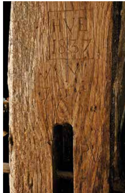
Een aangetroffen inscriptie op een gebintstijl van een boerderij in Boxtel.

De – heel nieuwsgierige – boerderijeigenaren krijgen natuurlijk eerder bericht.