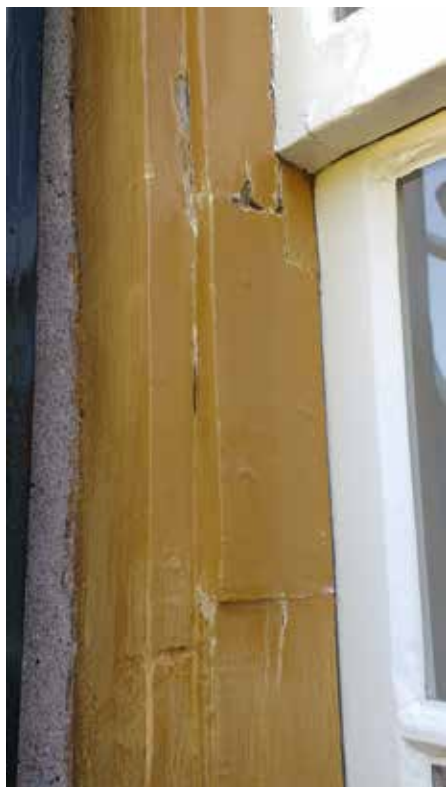
De linkerzijde van het raamkozijn met in het midden de plaats waar de inkeping aanwezig was voor een horizontale balk, die later is afgedekt.

lijkheden. Oftewel de kleine glasplaatjes werden met loodstrips aan elkaar vastgemaakt, wat we nu glas-in-lood zouden noemen. Oftewel de bovenlichten werden met houten latten verdeeld in kleine vlakken. Dat laatste blijkt bij de kozijnen van De Blauwe Kei het geval te zijn. De latten zijn niet in ramen, maar rechtstreeks in de kozijnen aangebracht. Later werden die latten eruit gezaagd, waarbij de eindjes achterbleven. Mogelijk gaat het niet om gaatjes van (glas)latten, maar waren in de bovenlichten zogenaamde diefijzers aanwezig. Dat zijn verticale ijzeren staven ter voorkoming van diefstal (glas-in-lood is niet zo stevig).