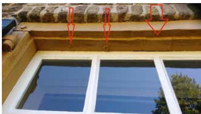
De linkerbovenkant van het kozijn. De brede pijl wijst naar de plaats waar de verticale middenstaander gezeten heeft. De twee smallere pijlen wijzen naar de resten van latten of naar stoppen in de gaatjes waar diefijzers aanwezig waren.

Een volgende eigenschap van kruiskozijnen is de aanwezigheid van halfhoge luiken. De bovenlichten konden niet met luiken worden afgesloten, maar de onderramen juist wel. Sterker nog: aanvankelijk waren de onderramen nog niet voorzien van glas. Het waren gewoon gaten, die bij slecht weer afgesloten konden worden met luikjes ten koste van het daglicht.