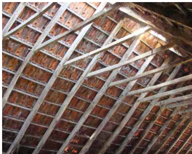
De sporenkap van de schuur in Vlierden vóór en tijdens de demontage.

De zorg voor ons materieel erfgoed in dit project leidt niet alleen tot behoud van de oude hout constructie, maar levert tevens gegevens op over de manier waarop in voorgaande eeuwen schuren en boerderijen werden gebouwd. Wordt vervolgd dus.