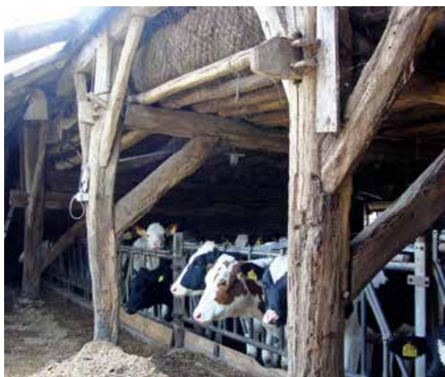
Toen de schuur in Vlierden nog in gebruik was. Inmiddels is de houtconstructie onderzocht en gedemonteerd. De schuur is van 1565 of 1780. Nader onderzoek is daarvoor nodig.

In het kader van het project Reanimatie Verloren Erfgoed worden oude schuren, die niet gehandhaafd kunnen blijven, gedemonteerd met als doel ze elders weer verantwoord op te bouwen. Op Groendomein Wasven in Eindhoven is een oude veldschuur uit Bavel herbouwd en in Haaren wordt een schuur herbouwd in de Holstraat, die eerder zo'n 3 km verderop stond.