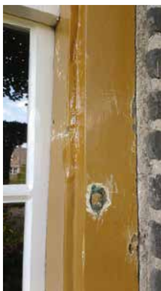
Een houten stop in een voormalig duimgat.

Opvallend is dat in alle vier de raamkozijnen van De Blauwe Kei juist op de plek waar de halfhoge luiken van de onderramen verwacht kunnen worden, houten stoppen zitten. De duimen waar de luiken aan hangen werden niet op de kozijnen geschroefd, zoals dat tegenwoordig gebeurt, maar de duimen waren voorzien van spitse punten en werden direct in de kozijnen geslagen. Na het verwijderen van de duimen werden de gaten met houten stoppen opgevuld.