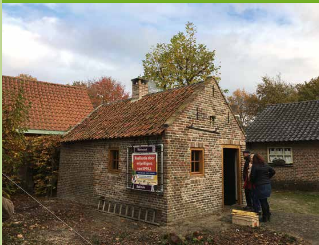
Het bakhuis aan de Barrierweg in Liempde na de restauratie.

Stichting de Brabantse Boerderij zoekt Vrienden. Vanaf € 22,- per jaar bent u Vriend van onze Stichting. U ontvangt daarvoor onze Nieuwsbrief met wetenswaardigheden over Brabantse boerderijen, bijgebouwen, erf en cultuurlandschap en aankondigingen van onze activiteiten. Ook krijgt u korting op onze publicaties en cursussen en u kunt deelnemen aan onze jaarlijkse Vriendendag. Maar vooral steunt u als Vriend het werk van SdBb.