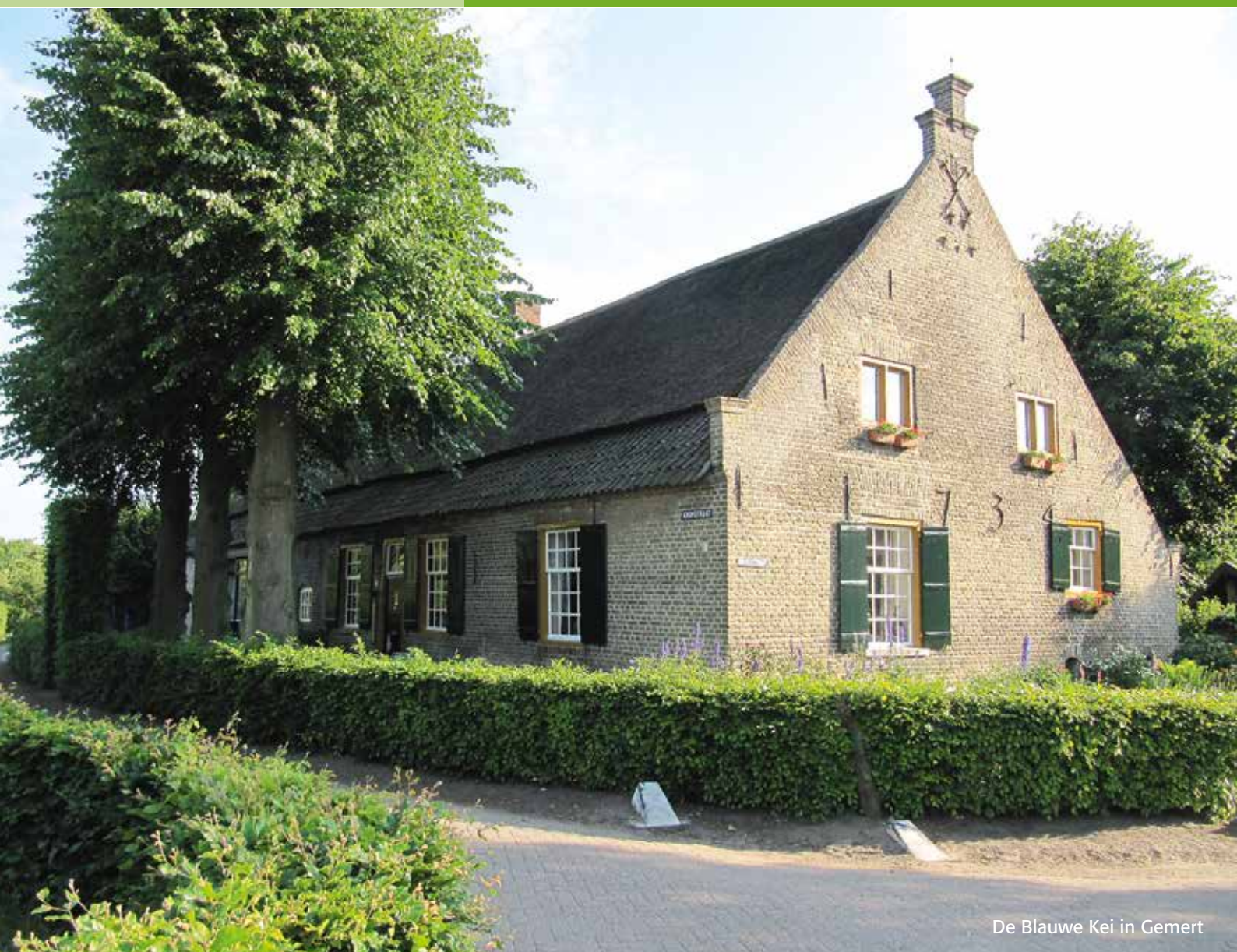
De Blauwe Kei in Gemert

SdBB brabantse se boerderijen, bijge ebouwen, erf en cul tuurlandschap.