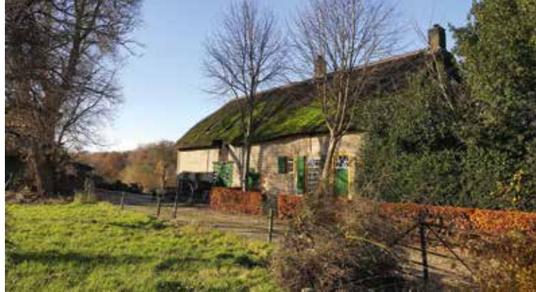
Deze boerderij in Made wordt bezocht tijdens de vriendendag 2017 op 1 april.

Vrienden kunnen zich tot 15 februari 2017 aanmelden, bij voorkeur door een mailbericht te sturen naar het secretariaat van SdBB: jwaalders@kpnmail.nl . Eventueel is telefonisch of per brief aanmelden ook mogelijk. Elke deelnemer ontvangt een bevestiging en zo nodig aanvullende gegevens. Voor aanmelden en vragen kunt u contact opnemen met Jan Aalders: jwaalders@kpnmail.nl of telefonisch (073-5474566 of 06-23103883).