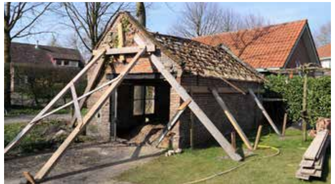
Het bakhuis aan de Barrierweg in Liempde vóór de restauratie.

Tegelijk met de presentatie van het boek werd ook een brochure aangeboden, uitgegeven door SdBB, die digitaal beschikbaar komt op de website www.cultureelerfgoed.nl . De brochure met als titel: "Authentieke erven, karakteristieke tuinen. De kenmerken van wederopbouwboerderijen" gaat in op de architectuur in de Scheeken, maar vooral op de karakteristiek van boerenerven uit de periode van de wederopbouw. Met deze brochure sluit SdBB het ervenproject af.