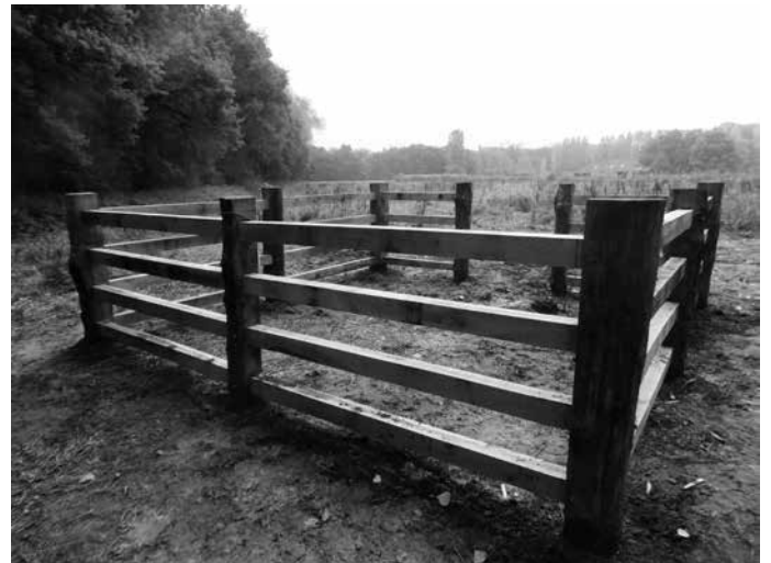
In Liempde is een authentieke schutskooi gemaakt aan de Schutstraat.

De schutter lette vooral op vreemde beesten en beesten die anderen benadeelden. Deze sloot hij op in een schutskooi. De eigenaar kon het vee terugkrijgen tegen betaling van een boete: het schutgeld. Kon hij dat niet, dan werd het vee publiek verkocht, wat ook gebeurde als de eigenaar niet kwam opdagen. Het schutgeld was een vooraf vastgesteld bedrag per dag en "per schot". En is dat nu per beest of per eigenaar? In 1639 ontstond er een conflict tussen Heitrakse boeren (Deurne) en Asten. In Asten had men twee Heitrakse koeien geschut en men eiste een gulden schutgeld per dier terwijl die van de Heitrak beweerden dat bij het schutten van vee altijd één gulden voor alle dieren samen betaald was. Het schutten en het schutgeld bleef eeuwenlang een bron van onderlinge dorpswisten. Maar meer nog dan om het schutgeld ging de onenigheid vaak over de vraag waar precies de grens lag.