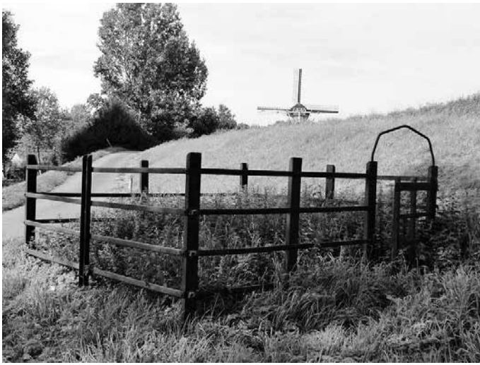
De schutskooi in Dieden is inmiddels een rijksmonument.

nagel, yder scheij in alle de paale en de palen prexies even ver van malkanderen verdeelen”.