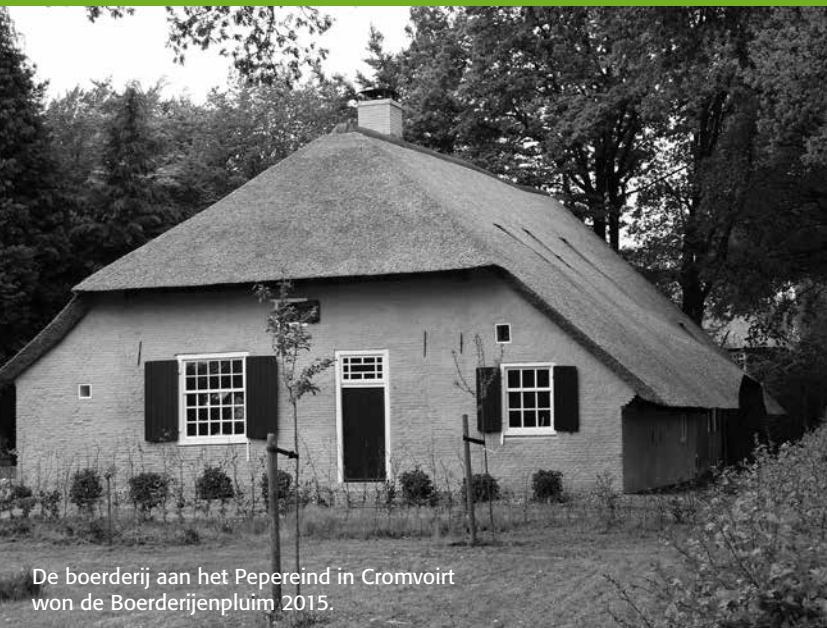
De boerderij aan het Pepereind in Cromvoirt won de Boerderijenpluim 2015.