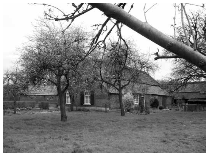
Fruitbomen bij een boerderij in Esbeek

Verdere informatie bij Cees Sleutjes tel 0411 632726 of op het E Mailadres snoeien.sdbb@outlook.com