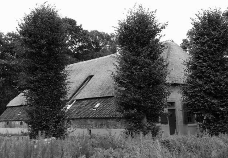
De boerderij in Rosmalen miste net de Boerderijenpluim 2015