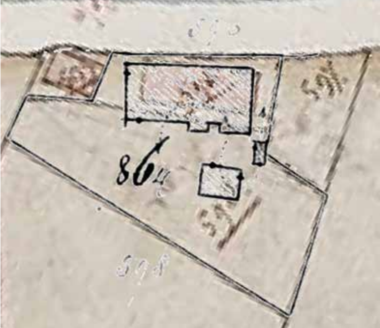
Op de achtergrond is vaag de kadasterkaart van 1832 zichtbaar. Daar bovenop een hulppkaart uit 1857. De boerderij blijkt in dat jaar verbreed en verlengd en rechts onderaan werd een kruk aangebouwd, zodat een krukhuus is ontstaan, dat nu nog bestaat (Kromstraat, Gemert).

vergunning te worden aangevraagd voor de bouw of verbouw van een pand. Dat geldt voor boerderijen, maar ook voor bijgebouwen. Bij elke bouwvergunning hoort in principe ook een bouwtekening. Vaak zijn afgegeven bouwvergunningen met bijbehorende tekening bewaard gebleven in de archieven van de gemeente die de bouwvergunning verstrekte. Het is afhankelijk van de gemeente vanaf welk jaar de gegevens bewaard zijn gebleven, maar meestal is dat vanaf het begin van de 20ste eeuw. Bij de gemeente en bij de archiefdienst die het gemeentearchief bewaard is hierover informatie aanwezig.