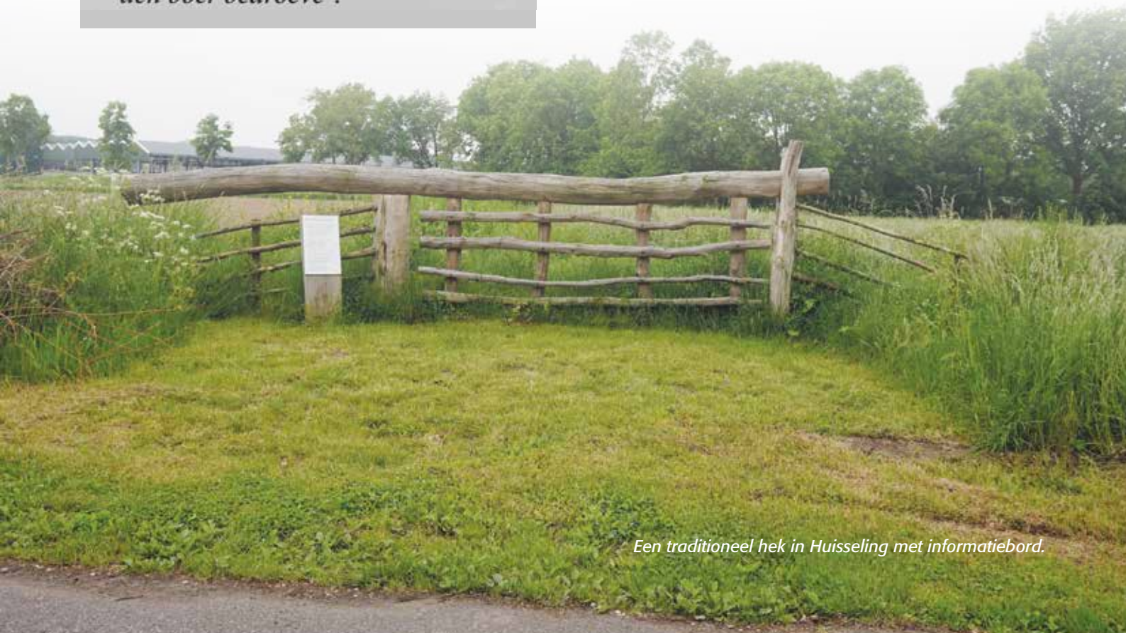
Een traditioneel hek in Huisseling met informatiebord.

De uitgave telt ruim 200 bladzijden in A4 formaat en bevat veel kleurenfoto's. Het boek is bij de Heemkunde Sprang-Capelle te koop voor 20 euro.